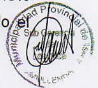
Gráfico N° 03

Respecto a los montos estimados de los procedimientos convocados durante el periodo enero a setiembre de 2018, se observa la predominancia de las Adjudicaciones Simplificadas representando el 48% y en menor proporción la Subasta Inversa electrónica representando el 44% del monto total programado en el PAC.